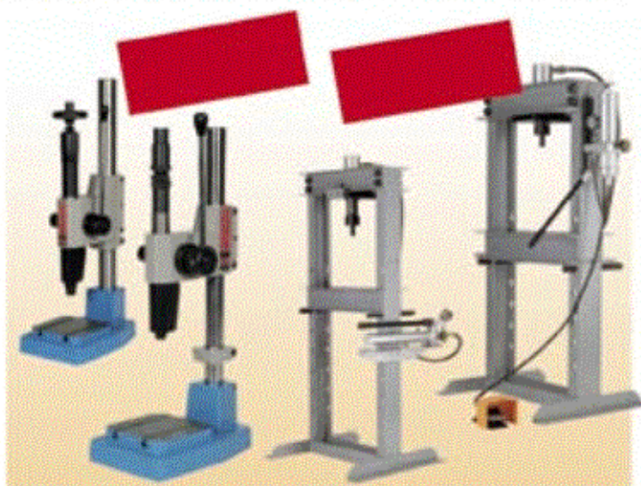
Markownice i warsztatowe prasy hydrauliczne

Rabat od wielkości zamówienia Dostępne na skądzie